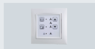
Lako upravljanje sustavom

Decentralizirani ventilacijski sustav AIRUNIT SOLUS 2.0 namijenjen je za kontroliranu ventilaciju prostorija s maksimalnim povratom topline od 99 %. Korištenje više uređaja u paru omogućuje učinkovitu ventilaciju cijelih stambenih jedinica ili zgrada.