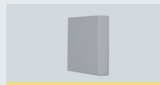
Zvučno-apsorbirajuća unutarnja obloga