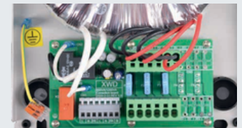
Jednostavna priključna tehnologija