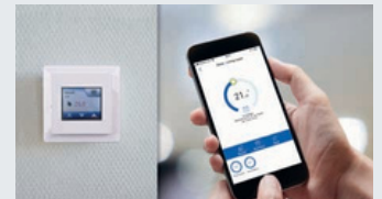
Priključivanje WiFi prostornih termostata