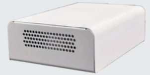
Kompletno u kućištu